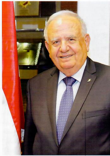
المؤسسات في لبنان.

وبأخذ موضوع مكافحة تبييض الأموال وتمويل الإرهاب أبعاداً عالمية نتيجة العولمة وإنفتاح الأسواق. وتداخل الاقتصاديات العالمية. وتعمل الهيئات التشريعية والتنفيذية والهيئات الناظمة دولياً وإقليمياً ومحلياً لوضع نصوص قانونية وأطر تنظيمية من أجل مكافحة أنشطة الجريمة المالية. لما لذلك من تأثير وتداعيات سلبية على القطاعات الاقتصادية والاجتماعية.